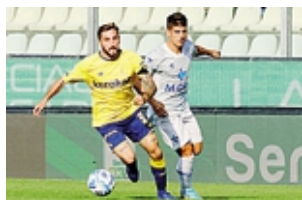
Da riscattare il 5-1 dell'andata

La società apre le porte del Siniaglia per l'ultima seduta di preparazione alla partita, molto sentita, in programma domani alle 15. CAMATORTA A PAGINA 45