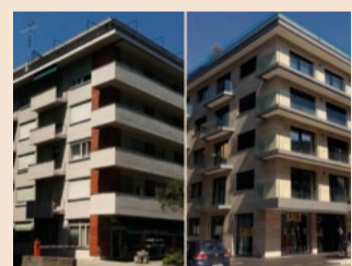
Aderma propone soluzioni certificate e collaudate per interventi di lunga durata a bassa manutenzione che rientrano nelle agevolazioni fiscali. - www.adermalocatelli.it

Nata da GL Locatelli si è specializzata nella progettazione e realizzazione di facciate ventilate. In 20 anni d'attività ha condotto ricerche internazionali per migliorare i benefici energetici applicabili su nuovi edifici e ristrutturazioni. La facciata ventilata riveste l'edificio con lastre di vario materiale, dalla ceramica alla pietra, lasciando un'intercapedine d'aria fra la lastra e l'isolante, migliorando così il comfort abitativo, riducendo i costi di riscaldamento e condizionamento, eliminando