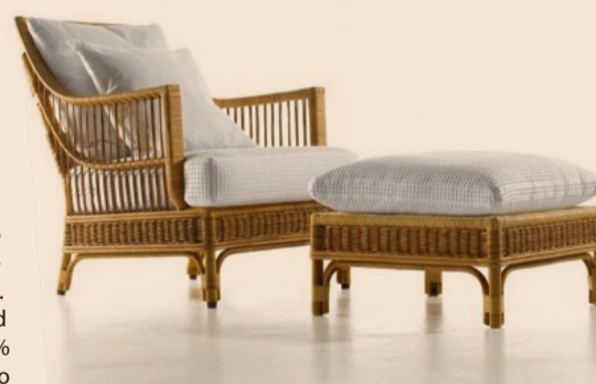
Bonacina1889. Poltrona Talide

L'identità di Bonacina1889 è data dalla tradizione di un materiale, il giunco (rattan), da una famiglia, i Bonacina, e da un luogo, la Brianza. Da 129 anni l'azienda accompagna ritmi e stili del tempo rimanendo punto di riferimento nel mondo dell'arredamento di design. Qualità, design, tradizione, storicità i punti di forza di questo brand che oggi come allora realizza ogni pezzo a mano con cura ed esperienza. L'azienda, rimanendo fedele agli intrecci naturali, che più di tutti hanno caratterizzato la sua storia, raccoglie le sfide di nuovi materiali e da vita a progetti di architetti e designer contemporanei attuando un processo di divulgazione internazionale. La quarta generazione, forte delle sue radici, si proietta verso il futuro rinnovandosi ed evolvendosi continuamente con spirito dinamico e appassionato. La crescita del 39% registrata nel 2017 rispetto all'anno precedente consolida la fiducia in questo approccio e ne incoraggia il proseguimento. - www.bonacina1889.it