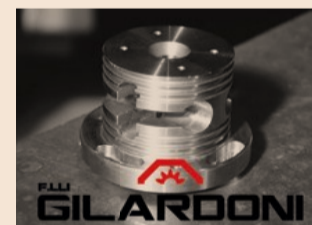
coadiuvati da macchinari d'avanguardia risultato della lungimiranza della famiglia Gilardoni, che ha continuato a investire in tecnologia per elevate capacità produttive.

Focalizzata sulla qualità del suo lavoro, Fratelli Gilardoni di Bellagio è partner d'eccellenza delle più grandi aziende italiane ed estere nel settore metalmeccanico. Specializzata dal 1948 nella lavorazione del metallo su disegno del cliente, ha saputo rinnovarsi sia dal punto di vista organizzativo che tecnologico, trasformandosi da piccolo laboratorio artigiano a moderna realtà che sta affrontando la nuova sfida dell'Industria 4.0. Professionisti di grande esperienza lavorano i metalli più complessi per manufatti di altissima qualità, www.fratelligilardonisrl.it