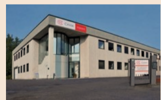
CAMA. La sede a Colverde (Como)

Dal 1984 Cama realizza impianti di riscaldamento idrotermici e di climatizzazione per l'edilizia civile, industriale e commerciale, focalizzando ogni l'attenzione sugli impianti ecologici a basso consumo energetico. L'attenzione in tutte le aree d'intervento: installazione, collaudo e manutenzione degli impianti, garantisce un prodotto d'eccellenza. Gli impianti assicurano l'efficiente funzionamento delle apparecchiature, manutenzione semplificata e risparmio economico dato dalle minime dispersioni ter-