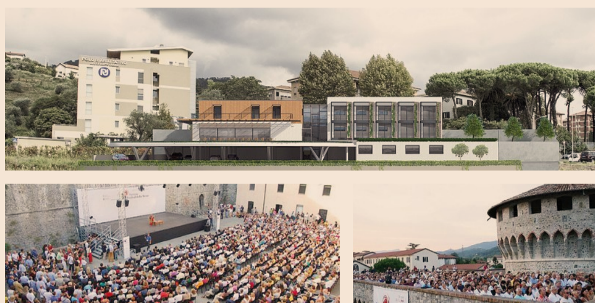
Inclusione e partecipazione. A sinistra, in alto, il rendering della locanda-ristorante Vivere la Vita del progetto AutAut, che sarà inaugurata a primavera. In basso, in entrambe le foto, alcuni momenti del Festival della Mente di Sarzana, giunto alla 15esima edizione

Il progetto AutAut. Dal suo avvio, nel 2015, a oggi, al progetto AutAut sono stati destinati oltre 5 milioni di euro, parte dei quali destinati alla ristrutturazione degli edifici destinati al campus agricolo inaugurato nel 2016 e alla locanda-ristorante che aprirà quest'anno